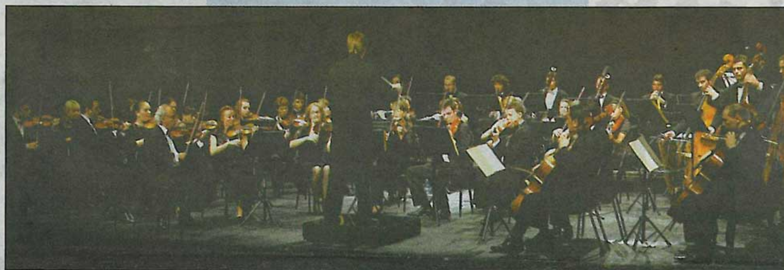
ЦРНОГОРСКИ СИМФОНИЈСКИ ОРКЕСТАР